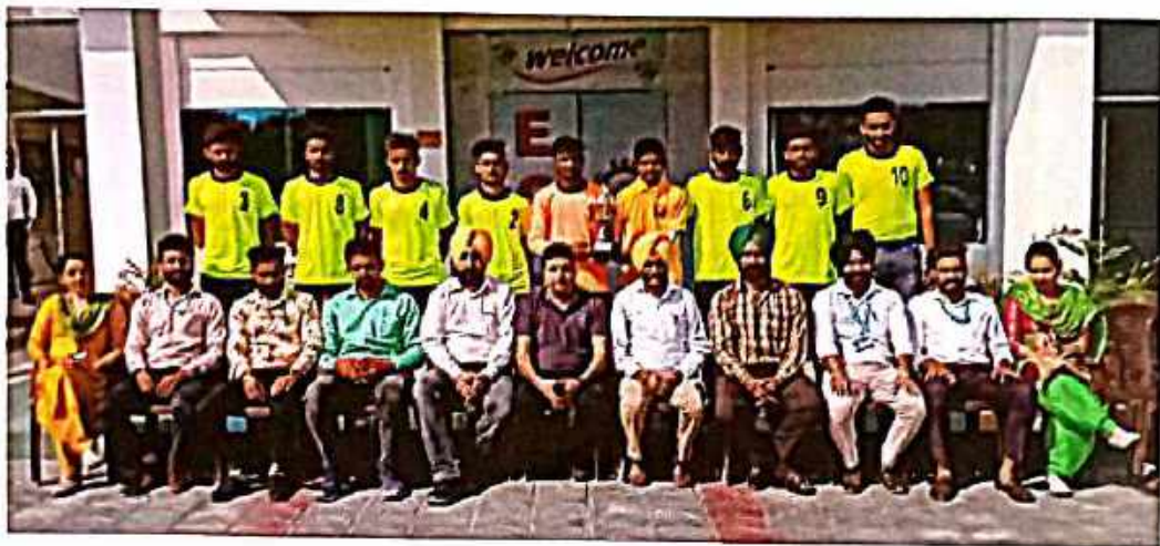
Inter College Football Championship 2019-20 (Runner-up)