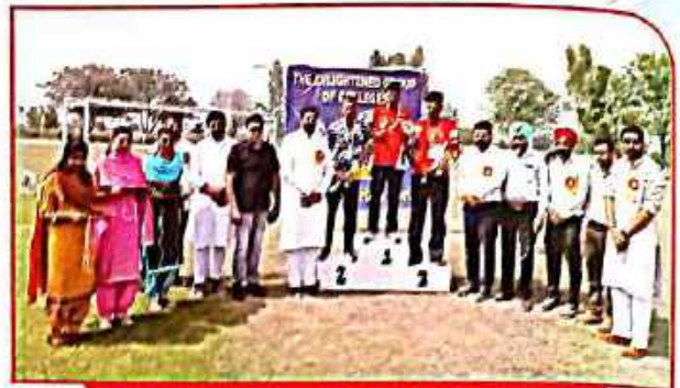
Annual Athletics Meet 2020-21