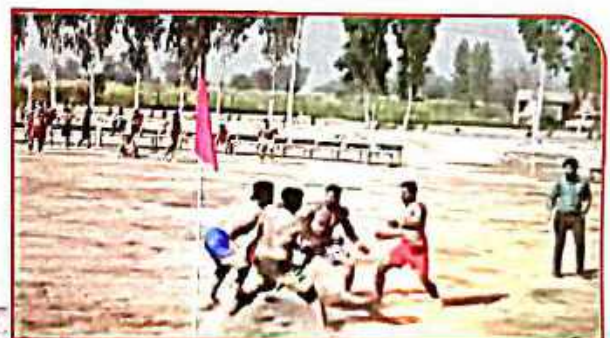
All India Inter University (Kabaddi Championship)