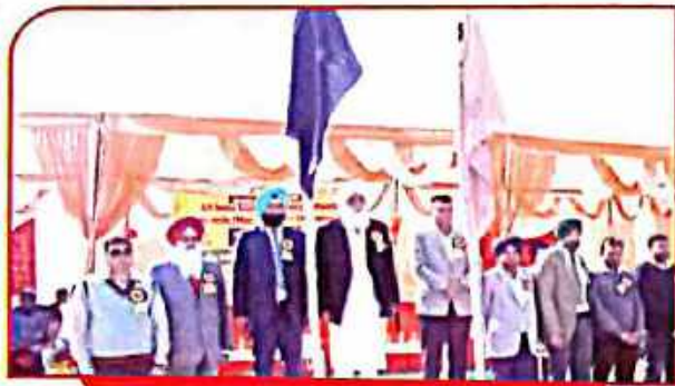
All India Inter University (Kabaddi Championship)